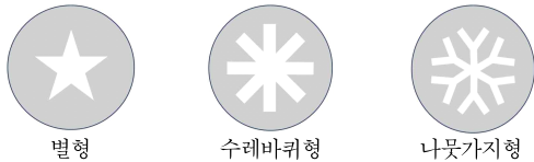
<그림 2> 내면연소 그레이인의 단면 형상

그레이인의 연소 방식 중에서 내면연소 방식이 가장 많이 사용된다. 내면연소 방식은 단면연소에 비해 연소 되는 면이 넓어서 강한 추력을 내는 데 유리하며, 로켓의 외부 표면에 전달되는 열이 적어 외면연소나 내외면연소 방식에 비해 안전하다. 내면연소 방식은 그레이인의 단면 형상을 달리하여 추력의 크기를 다르게 낼 수 있다. 내면연소 그레이인의 단면 형상은 <그림 2>와 같이 별형, 수레바퀴형, 나뭇가지형 등이 있다.