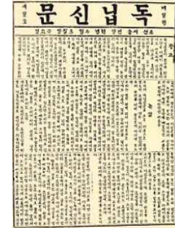
독립신문(1896 ~ 1899)