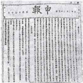
상하이 신보(1872 ~ 1949)