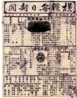
요코하마 마이니치 신문(1870)