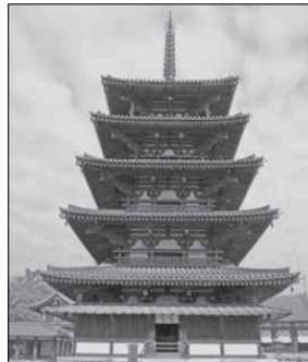
호류 지 5층 목탑(7세기)