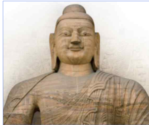
<원강 석굴 대불>