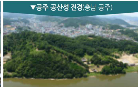
▼공주 공산성 전경(충남 공주)

본래 둘레가 약 3.5km, 밑변이 30~40m, 높이가 15m, 넓이 약 26만 평으로, 현존하는 토성 중 대한민국에서 최대 규모이다.