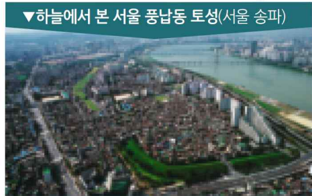
▼하늘에서 본 서울 풍납동 토성(서울 송파)

본래 둘레가 약 3.5km, 밑변이 30~40m, 높이가 15m, 넓이 약 26만 평으로, 현존하는 토성 중 대한민국에서 최대 규모이다.