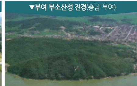
▼부여 부소산성 전경(충남 부여)

475년 백제 문주왕이 웅진(지금의 공주)으로 천도하여 538년(성왕 16) 사비(지금의 부여)로 옮길 때까지 백제의 정치·경제·문화의 중심지였던 웅진을 보호하기 위해 축조되었다.