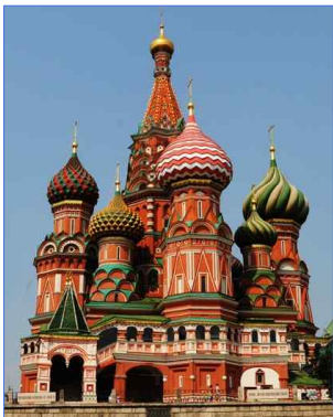
<성 바실리 성당>