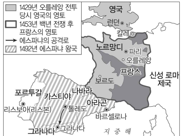
<프랑스와 에스파냐의 영토 변화>