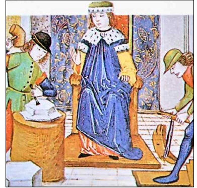
<장인 · 견습공>