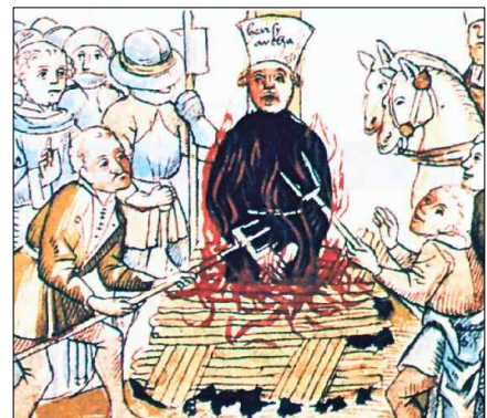
<회영 당기는 후스>