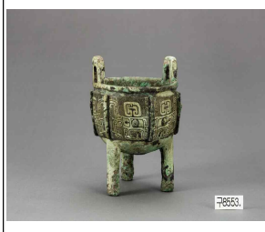
사진 속 유물은 이 국가에서 제사를 지낼 때 사용한 청동 술이다. 이 국가의 최고 지도자는 짐을 쳐서 국가의 중대사를 결정하였는데 이를 신정정치라고 한다.